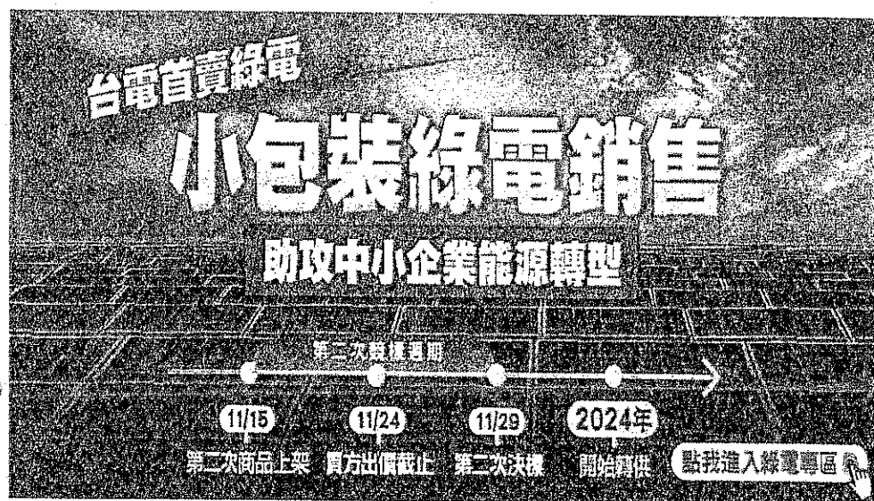
台電公司小額綠電標售期程

國際淨零碳排趨勢日漸抬頭，國內企業對綠電及憑證之採購需求快速攀升，經濟部標準檢驗局(下稱標準局)為協助綠電暨憑證供需雙方交易，提出多元解決方案，訂定「國營事業案場再生能源電力及憑證媒合服務作業程序」，並於國家再生能源憑證中心(下稱憑證中心)官網打造嶄新「綠電競標區」，與台灣電力股份有限公司(下稱台電公司)合作，供台電公司推出之「小額綠電銷售試辦計畫」使用。台電公司規劃 112 年 11 月 15 日於標準局憑證中心綠電媒合平台上架自建綠電供企業競標，歡迎各企業參與競標購買綠電。