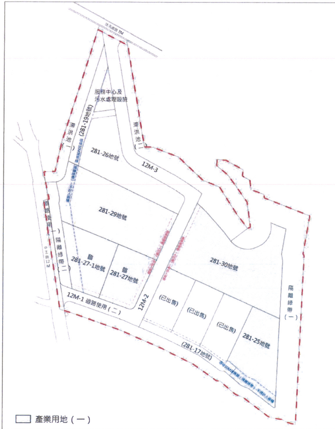
附圖一、埔里地方特色產業微型園區產業用地 (一) 土地坵塊圖